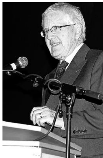
Auftritt. Kaspar Villiger in Conthey.

Und was sagen die Aktionäre zum Entscheid auf einen Dividendenverzicht? «Die grossen Anleger sind verständnisvoller als die kleinen. Aber wir müssen durch die Vorgaben der Finanzmarktaufsicht (FIN-